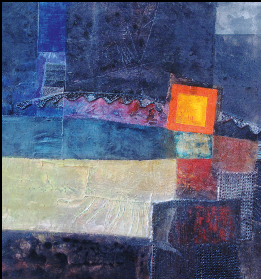
PETRA TSCHERSICH, BILDER