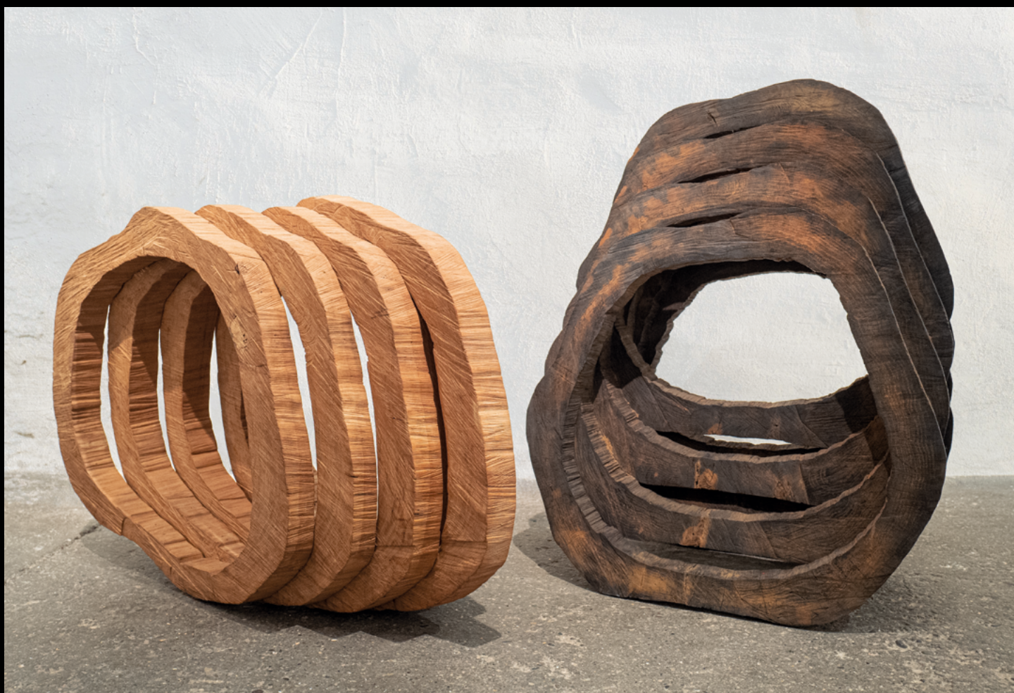
BEAT BREITENSTEIN, SKULPTUREN